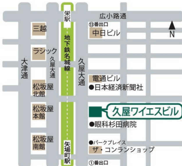
▼久屋ワイエスビル